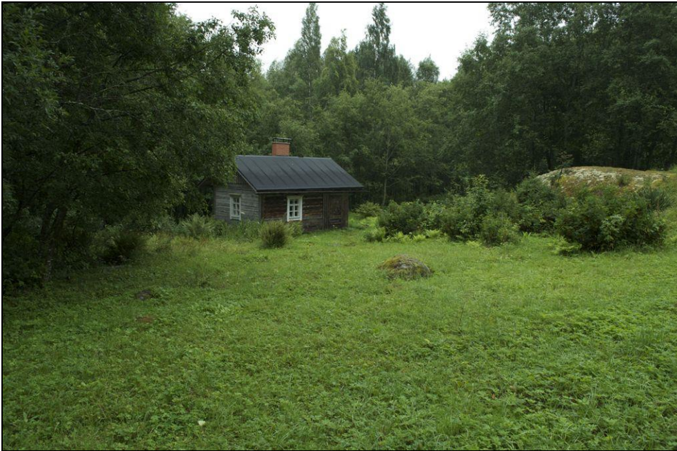
Kuva 60. Soikkelin pihapiiri.